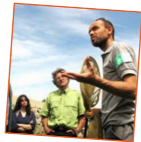
Aide aux projets